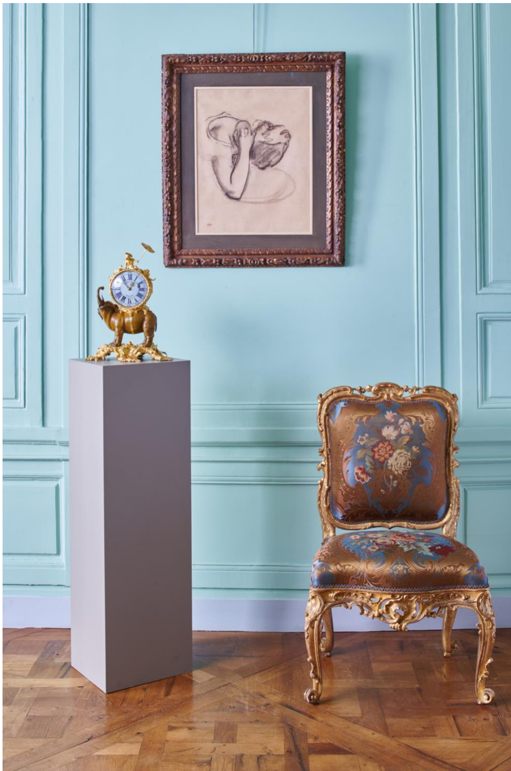
Pendule à l'éléphant époque Louis XV (Pascal Izarn) Edgar Degas Femme s'épongeant la nuque Fusain et estompe 60x46 cm (de Bayser) Chaise rocaille à la reine en bois sculpté et doré, Allemagne, milieu du XVIIIe siècle (Galerie Léage)